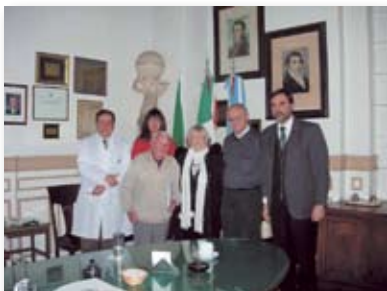
• En el consejo del HIG.