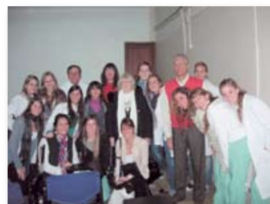
• Giai con estudiantes de Medicina.

Quería agregar por último que me sentí muy cómoda. Parte de la colectividad italiana durante mucho tiempo no entendió que Uds. son un eslabón importante dentro de ella pero considero que están cambiando los criterios sobre este tema. Gracias por la invitación.”