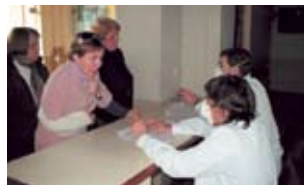
• Triage en el HIG.

Alumnos de 6º año de la Carrera de Medicina desarrollaron acciones voluntarias en el Hospital Italiano Garibaldi (y en el Policlínico) a propósito de la pandemia del virus de la Influenza A. La actividad, llamada TRIAGE EPIDEMIOLOGICO, apunta a la derivación a un área específica preparada a tal fin, a pacientes con riesgo potencial de padecer el virus H1N1, y separarlos de pacientes que ingresan al nosocomio por otros motivos. El TRIAGE se realizó durante todo el mes de julio en el Hospital con rotaciones permanentes de nuestros estudiantes.