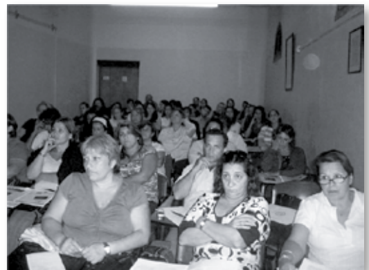
• Asistentes al curso de Enfermería y el cuidado del adulto en AVM.

De esta manera, consideramos alcanzados los objetivos establecidos y, dado el interés despertado por este tipo de actividades, se analizará realizar nuevamente el dictado de este curso tanto en el IUNIR como en otros centros relacionados.