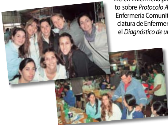
• La lluvia dio lugar a otras actividades bajo techo.