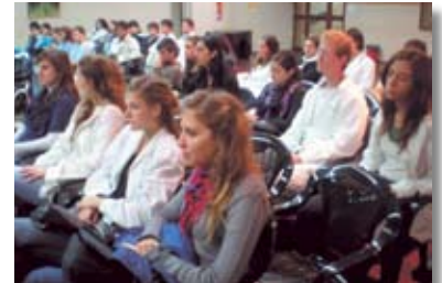
• Actividad central de la semana del estudiante.