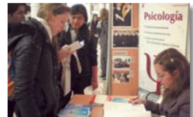
• Numerosas en consultas en nuestro stand.