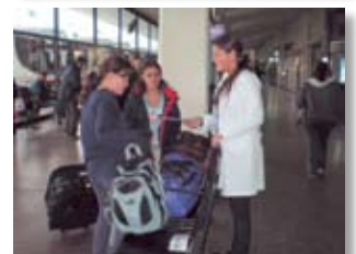
• Día D en la Terminal.