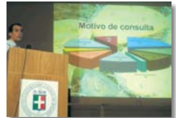
• Experiencia en el Impenetrable.

de Rosario. Por último, el Secretario Académico del IUNIR y organizador de la Semana, Dr. Walter A. Bordino, habló sobre ¿Qué es Aprendizaje Servicio Solidario? , para arribar a las conclusiones finales y darle lugar a lo que fue, al día siguiente, la jornada deportiva. El día no acompañó en el complejo polideportivo de la Asociación Médica de Rosario (Arroyo Seco). La lluvia constante parecía haber aguado las expectativas de juego aunque esto no sucedió. Los chicos aprovecharon de la jornada de igual manera, poniéndole buena cara al mal tiempo.