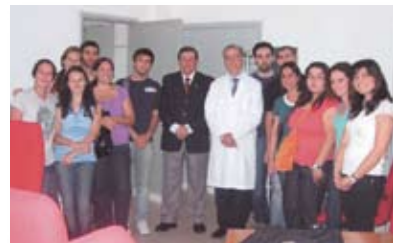
• Alumnos del IUNIR y de Catania, beneficiados por el intercambio estudiantil.