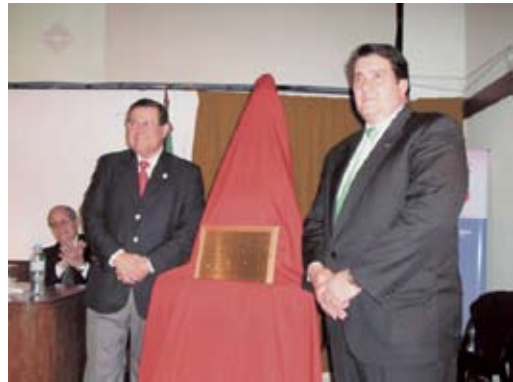
• El Rector del IUNIR junto al Presidente del COR descubren la placa conmemorativa.