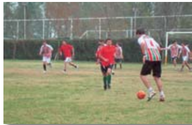
• Semana del Estudiante - Jornada deportiva bajo la lluvia.