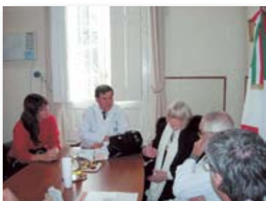
• En el consejo del IUNIR.