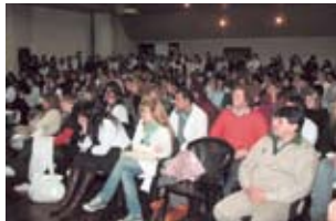
• Auditorio atento a las explicaciones de los profesionales.