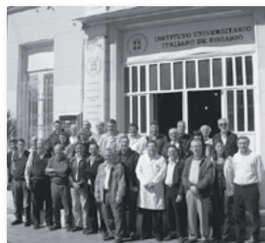
• IX Reunión de Claustro de Medicina 26 de setiembre de 2009.

La próxima Reunión de Claustro se realizará antes de iniciar el año académico 2010, en el próximo mes de febrero.