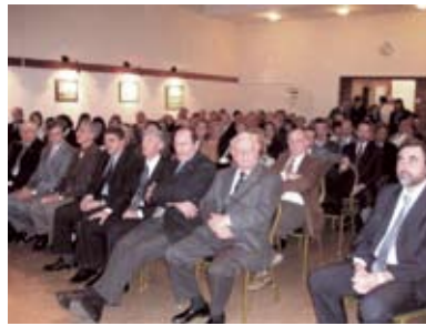
• Asistentes al acto.

Nacional de Buenos Aires, Director de la Escuela de Odontología de la Universidad del Salvador, Asociación Odontológica Argentina, y es Miembro de Número de la Academia Nacional de Odontología.