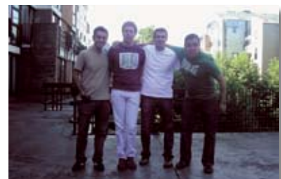
• Los protagonistas del primer intercambio académico entre el IUNIR y la Universidad Católica de Louvain.

en el servicio de Cirugía Hepato-bilio-pancreática y Trasplante. El IUNIR espera que esta primera experiencia sea muy provechosa para ambas Universidades y en particular para los estudiantes que realizan la Rotación Electiva de dos meses durante el 6to año de la carrera de Medicina.